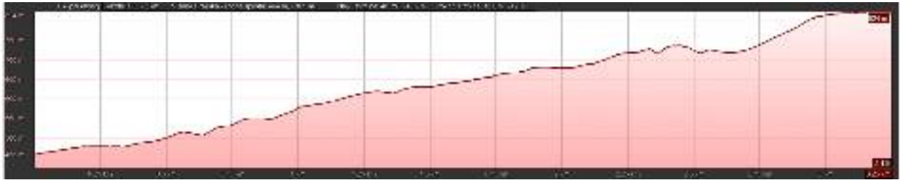
Graf: start: Vegrad – cilj: cerkvica Sv. Primož

Proga B: dolžina 3,5 km; višinska razlika 444 m. Čas teka je omejen na eno uro.