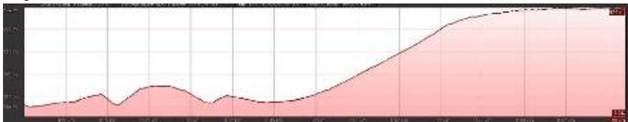
Graf: start: konec makadamske poti pri ovinku (Prelesje) – cilj: cerkva Sv. Primož

Proga B: dolžina 1,10 km; višinska razlika 175 m.