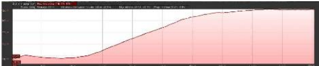
Graf: start: pri Turškem znamenju – cilj: cerkva Sv. Primož

Proga A: dolžina 0,7 km ; višinska razlika 70 m.