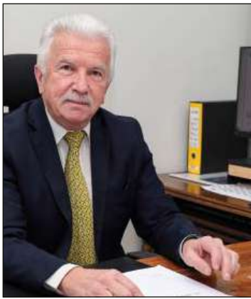
Župan Občine Izola Mayor of Izola Milan Bogatič