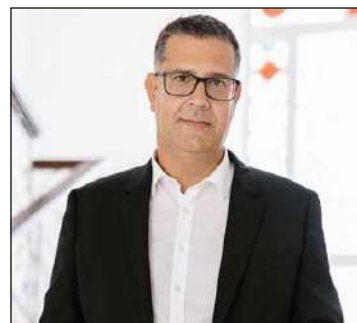
Župan Občine Koper Mayor of Koper Aleš Bržan

Skupaj z Občino Izola bomo v prihodnje še nadgradili ureditev obalne ceste, ki smo jo leta 2017 zaprli za motoriziran promet in tako vrnili občankam in občanom ter obiskovalcem. Poleg tega bomo z izgradnjo vertikalne povezave med Žusterno in Markovcem marsikomu olajšali izbiro za premikanje med Koprom in njegovim primestjem s kolesom.